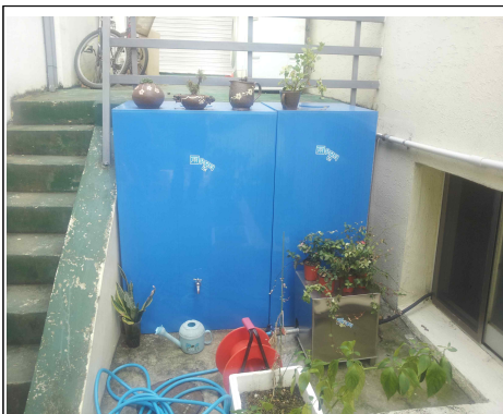
<소형 빗물 저장탱크>