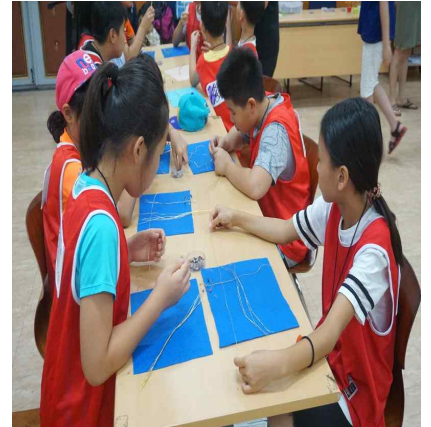
익산보석박물관 만들기 체험