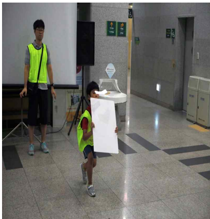
과학 놀이 체험 프로그램