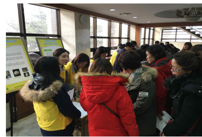
치매지원센터 홍보 및 기억친구모집