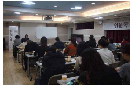
[인문학특강-인문학으로 본 예술 1강]