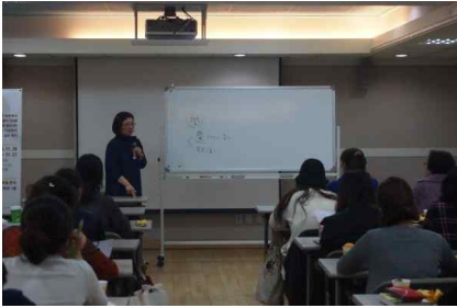
[인문학특강-인문학으로 본 예술 2강]