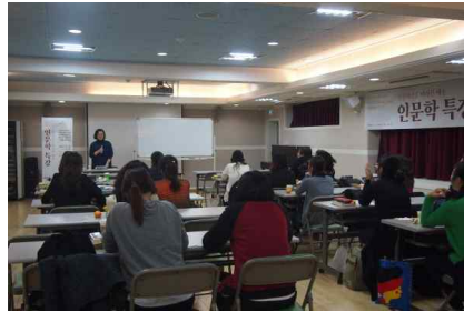
[인문학특강-인문학으로 본 예술 1강]