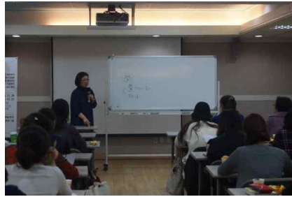
[인문학특강-인문학으로 본 예술 1강]