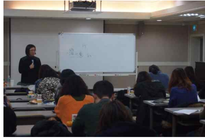
[인문학특강-인문학으로 본 예술 2강]