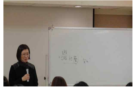
[인문학특강-인문학으로 본 예술 2강]