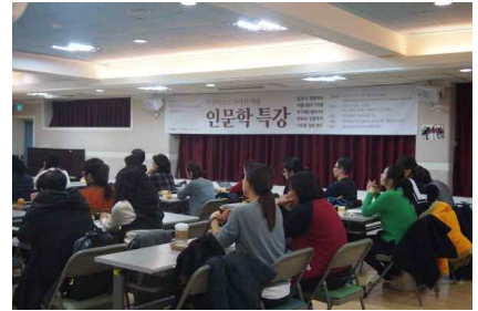
[인문학특강-인문학으로 본 예술 1강]