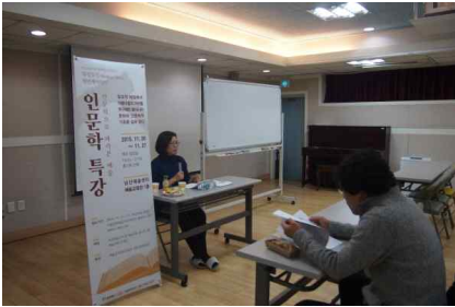
[인문학특강-인문학으로 본 예술 1강]