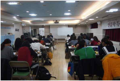
[인문학특강-인문학으로 본 예술 1강]