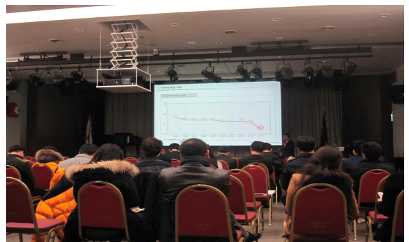
[2015년 공공구매 설명회]