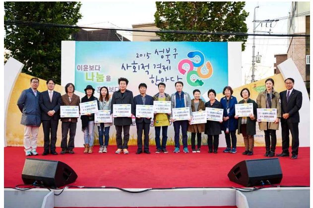
[2015년 사회적경제 한마당]