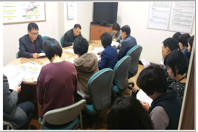
붙임 팀주임회의자료 1부. 끝.