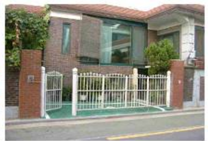
<공사비 반환대상 주차장기능미유지>

- 주차장 기능을 유지하는 선에서 높이 1.3m이내 개방형 펜스 등 설치 허용(단, 가옥주 부담)