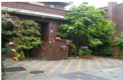
<현재-현관 출입문 주변 목책문 설치>

※ 사생활 침해 및 방범불안으로 사업참여를 취소하거나 거부하는 가옥주 유인책 강구