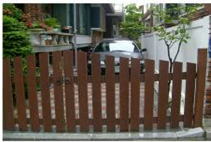
<개선-담장경계에 개폐식 목책문 설치>