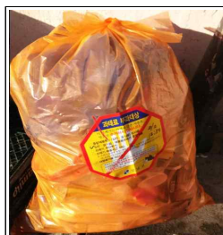
대행업체단속대상 스티커 부착