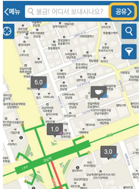
현재 보이는 가격은 1시간 기준입니다. (단위: 천)