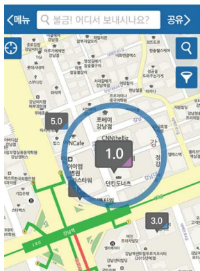
현재 보이는 가격은 1시간 기준입니다. (단위: 천)