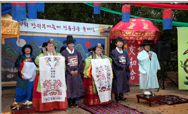
원삼, 활옷 등 전통혼례 재현시 필요한 의상 등