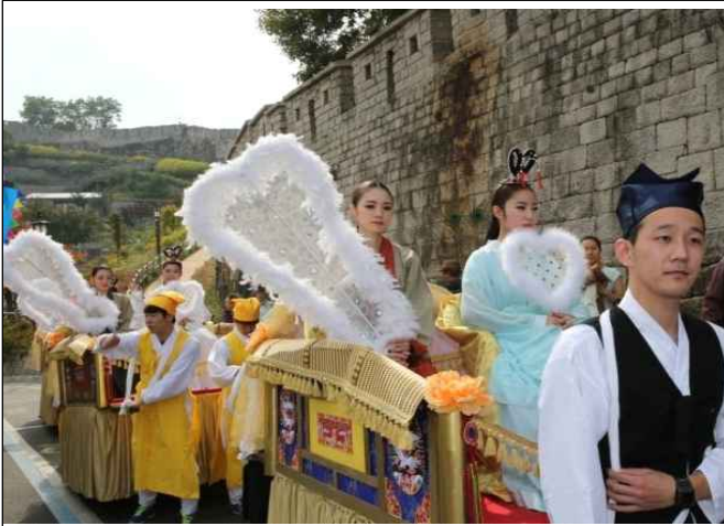
가마, 부채 등 선녀축제 시 필요한 소품