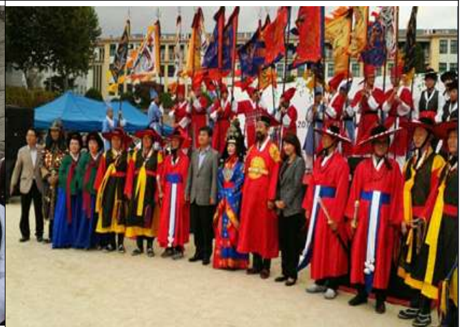
어가행렬시 필요한 의상 및 소품