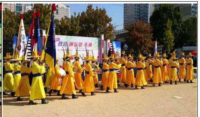
전통행사 지원 성북취타대(가칭) 악기, 의상 등