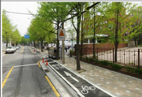
월곡로 : 안전펜스정비