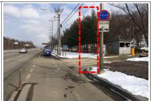
천호대로 : 안전표지정비