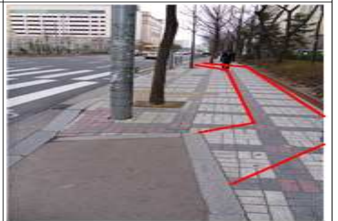
목동동로 단절구간 : 노면표시