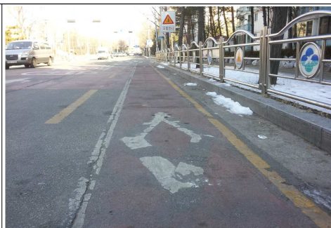
노티울길 : 노면표시 재도색