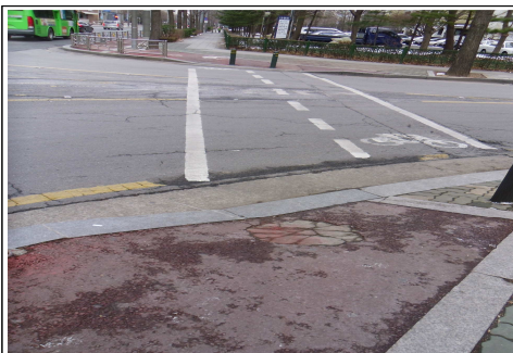
목동서로 : 포장정비