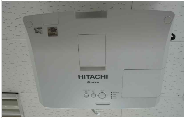
교육기자재 (천정부착 프로젝트빔)