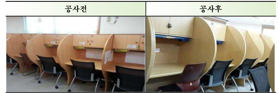
3층 책상 교체(42개)