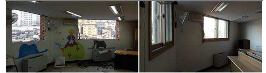
2층 창호교체 및 도색