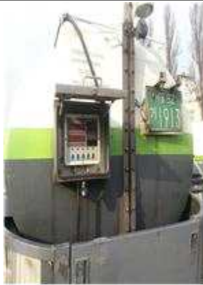
전자 계측 시스템