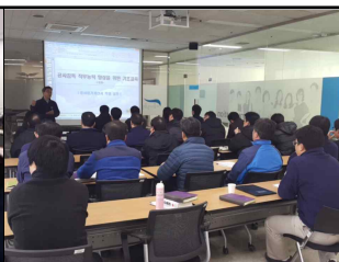
직무능력 향상 기초 교육