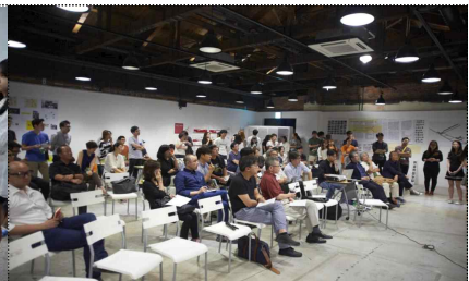
1차 평가단 심사