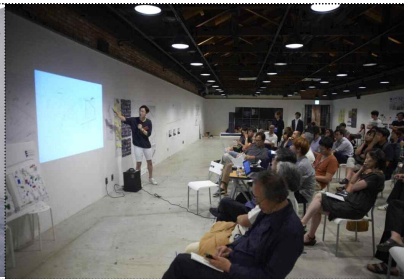
팀별 발표 및 1차 평가단 심사