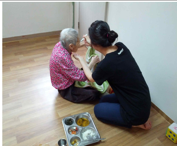
자양2동..광진노인보호센터 식사도움 ..