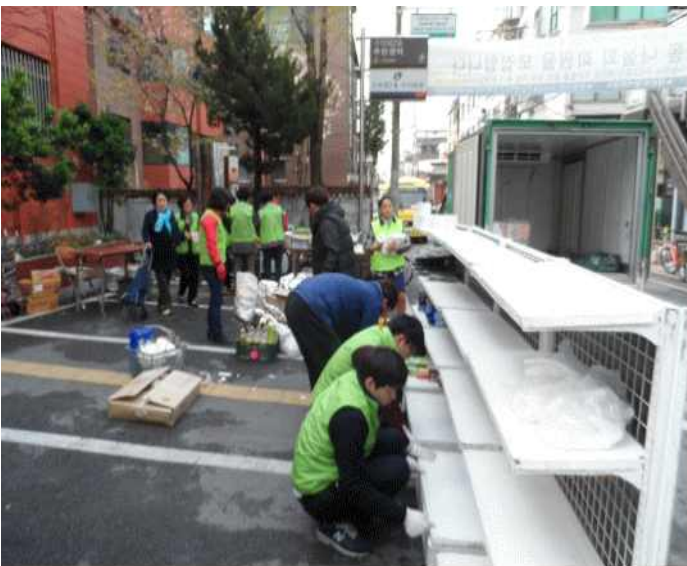
복지정책과..푸드마켓 나눔행사 지원