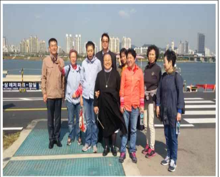
능동..장애우와 함께하는 가을나들이