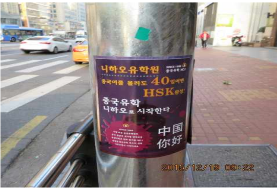
역삼1동 강남대로 불법침지류 정비