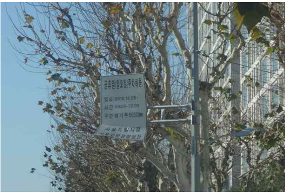
감사담당관 남부순환로 교통표지판 휘어짐