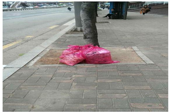
청소행정과 강남대로 무단배출 쓰레기 정비