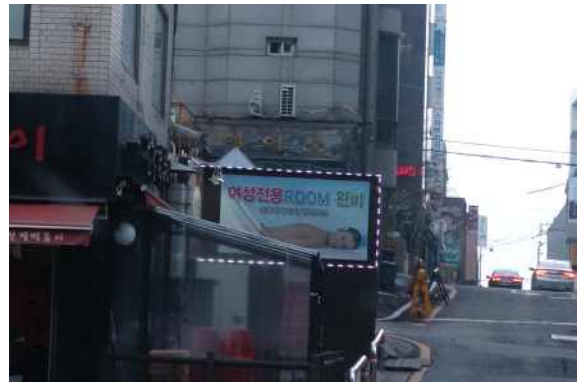
감사담당관 학동로 불법 현수막 제거