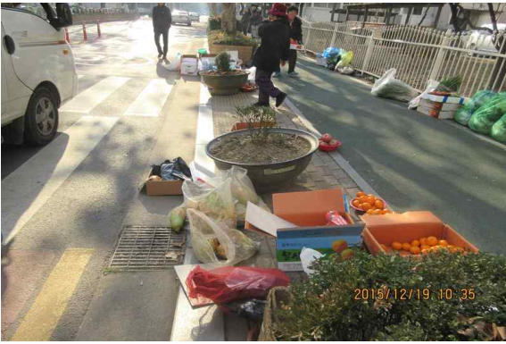
건설관리과 수서동 불법노점 정비