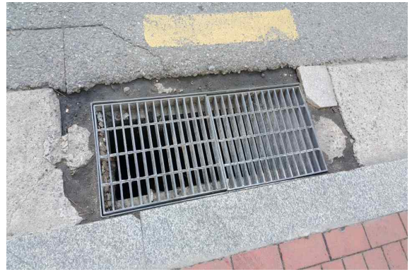
치수과 강남대로 빗물받이 주변 파손