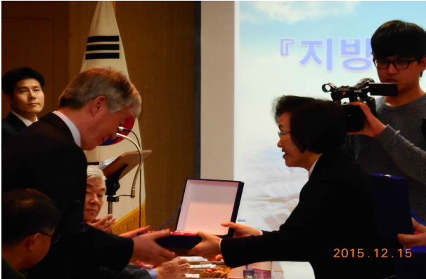
- 감사패 시상 -