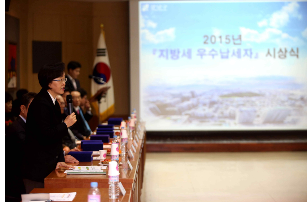
- 인사말씀 -