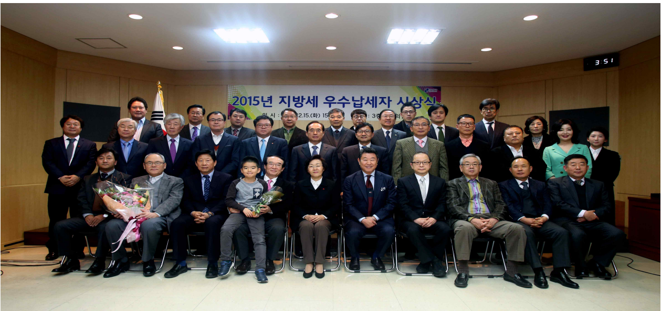
- 기념촬영 -