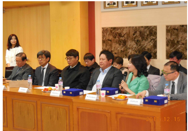
- 수상 소감 -