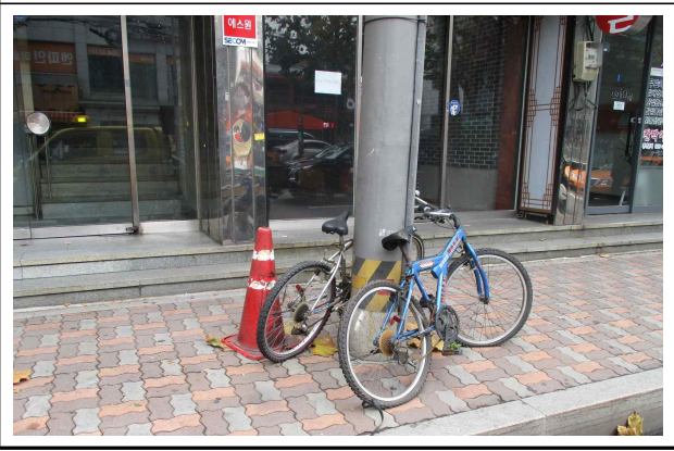
역삼로 자전거 무단 방치