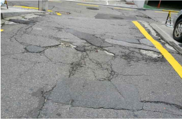
강남대로 부근 이면도로 파손