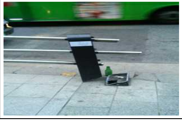
삼성역5번 출구 방호울타리 파손