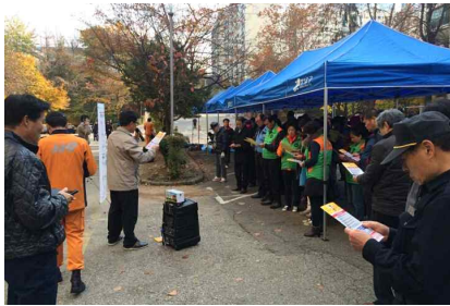
대피요령 교육(훈련 전)