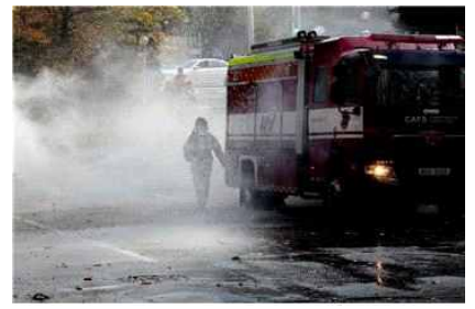
화재발생 및 소방서 출동