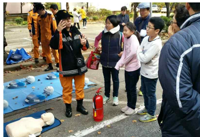
소화기 관리방법 교육