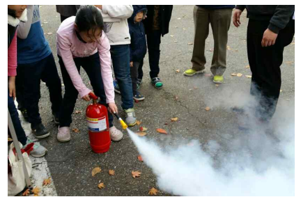
소화기 사용 실습