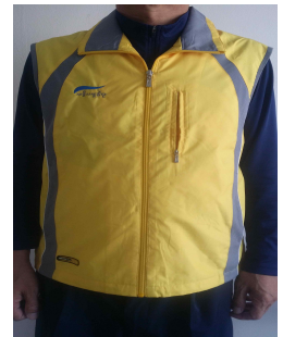
파트 및 봉사조끼