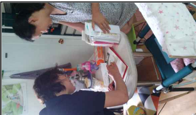
〈7.9. 가정 에너지클리닉서비스 진단사진〉