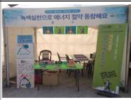
<4.10. 행사부스운영 재활용작품전시>