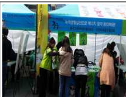
<3.15. 만민공동회 행사 부스 운영>