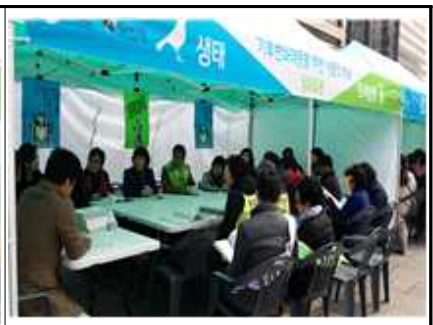
<3.15. 시민토론회 참석>