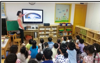
<6.3. 신일유치원 기후학교운영>