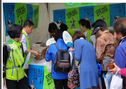
<4.28. CO 2 1인1톤 줄이기 캠페인 >