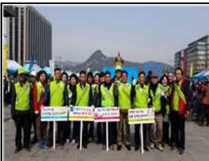
<3.15. 만민공동회 행사 참여>