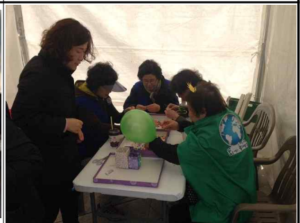
<4.10. 행사부스운영 태양뿔짜민들기>