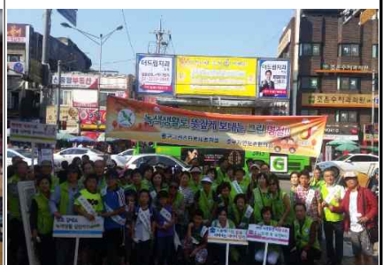
<9.23. 저탄소명절보내기 캠페인>