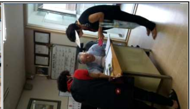
〈8.10. 경로당 에너지클리닉 진단사진〉