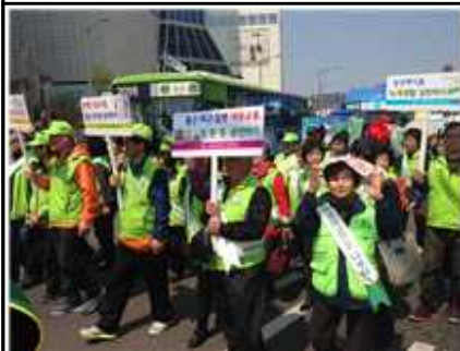
<4.10. 서울의약속 거리행진>