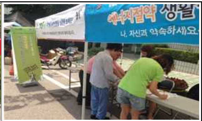
〈7.2. 에너지효율화사업 홍보〉