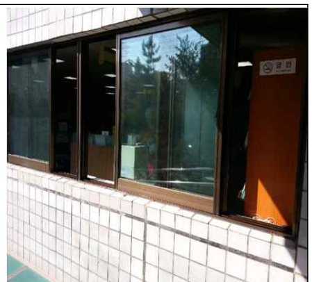
1,2층 알루미늄 단창 철거 후 이중창 설치