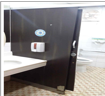
틀어지고 녹슨 장애인 화장실 문, 위생기구(세면기 등) 설치공사