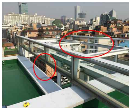
옥상 비가림막 (폴리카보네이트) 설치로 낙수 방지