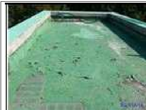
노후되고 벗겨진 옥상 우레탄 방수 및 도막방수 공사