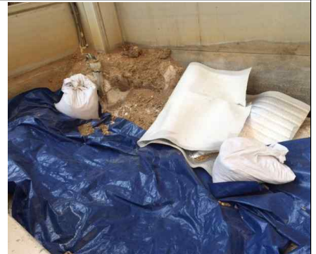
화단에 적치된 인공모래 폐기처리 및 혼합토 복토