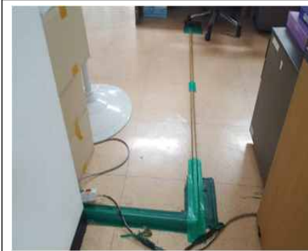
바닥에 복잡하게 얽힌 전기, 전화, 인터넷 배선 ⇒ 천장으로 이전설치, 배선공사 및 케이블 교체