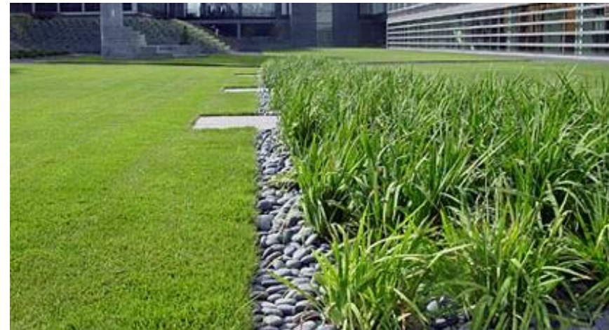
자 갈 수 로