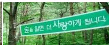
마라톤 응원 및 안내 현수막