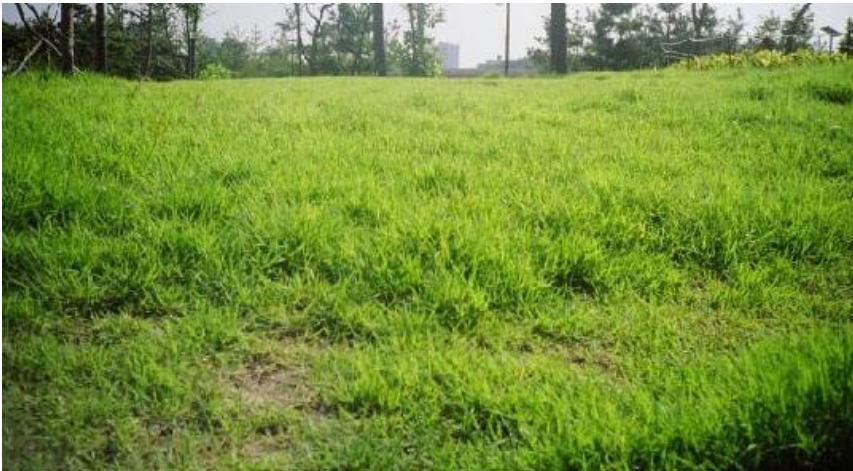
잔 디 수 로