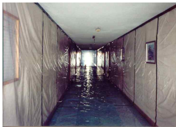
비닐설치 - 복도천장해체