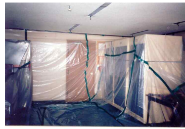
비닐설치 - 실내천장해체