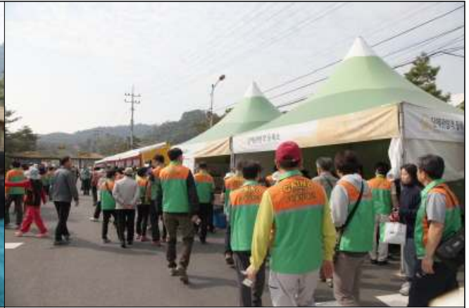
2015 괴산세계 유기농 산업엑스포 관람