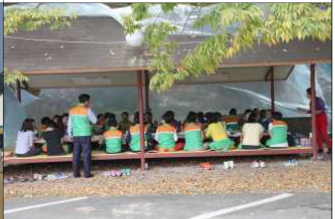
점심식사 시간에 단장님 한말씀