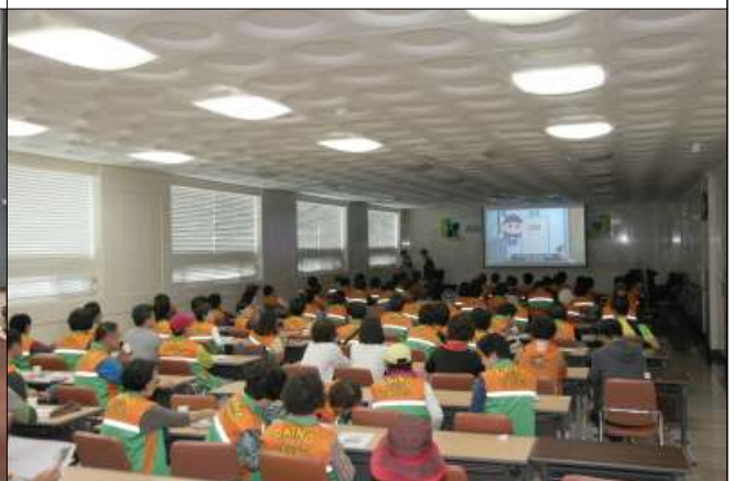
아파트화재 대처방법 및 선진안전문화운동 동영상시청