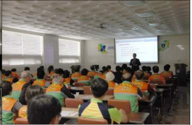
자율방제와 훈련 교육