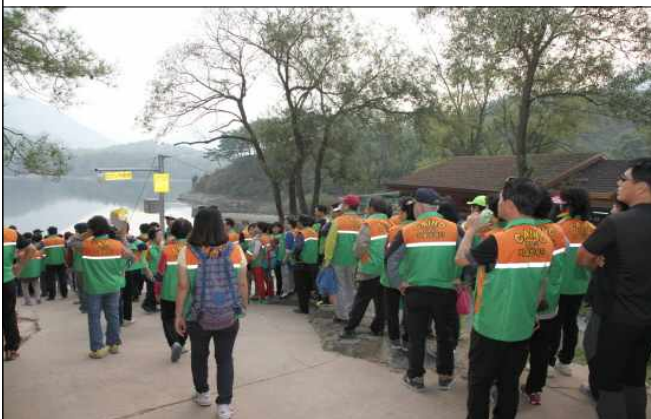
산막이 옛길 탐방