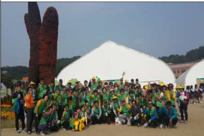
2015 괴산세계 유기농 산업엑스포 관람