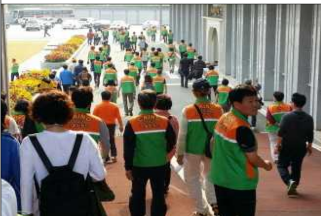
중원대학교 교육장 가는길