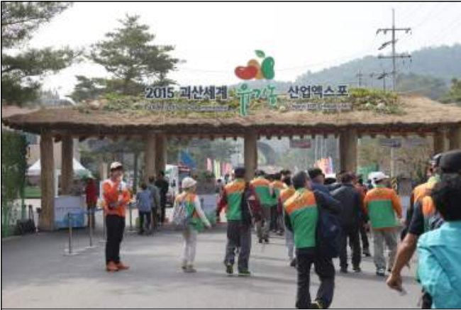
2015 괴산세계 유기농 산업엑스포 관람