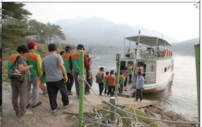
산막이 옛길 유람선