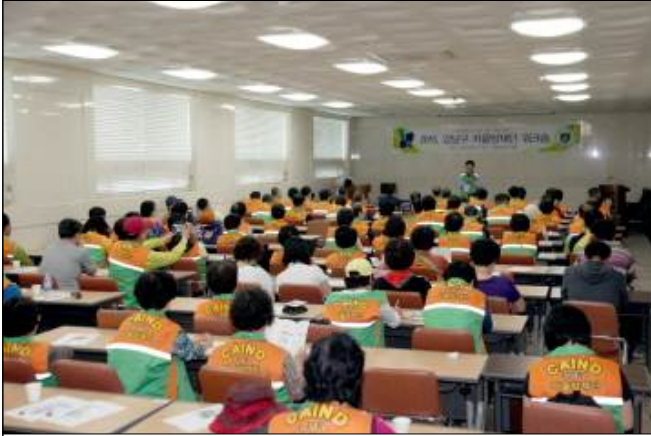
단장님 인사말씀 및 강사소개