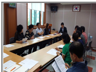
거울길 사업 설명