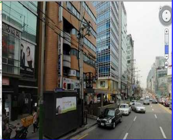
2) 남부터미널(3호선) 5번 출구(인재개발원 방향 100M 현대슈퍼빌 앞) 통근버스