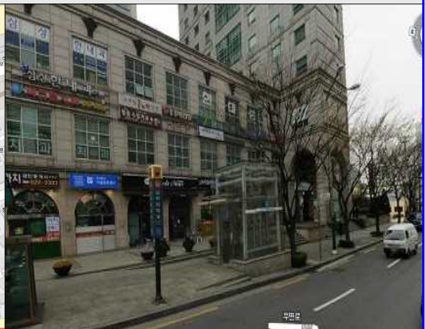
3) 사당역(2,4호선) 14번 출구(양재역방향 300M 연세사랑병원 앞) 통근버스