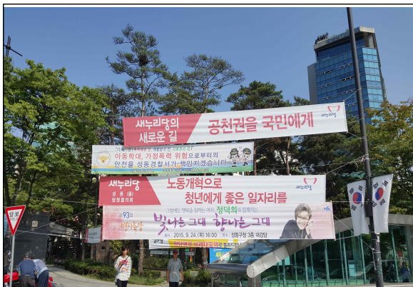
왕십리 문화공원 앞