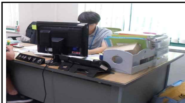
피의자 신문 시행