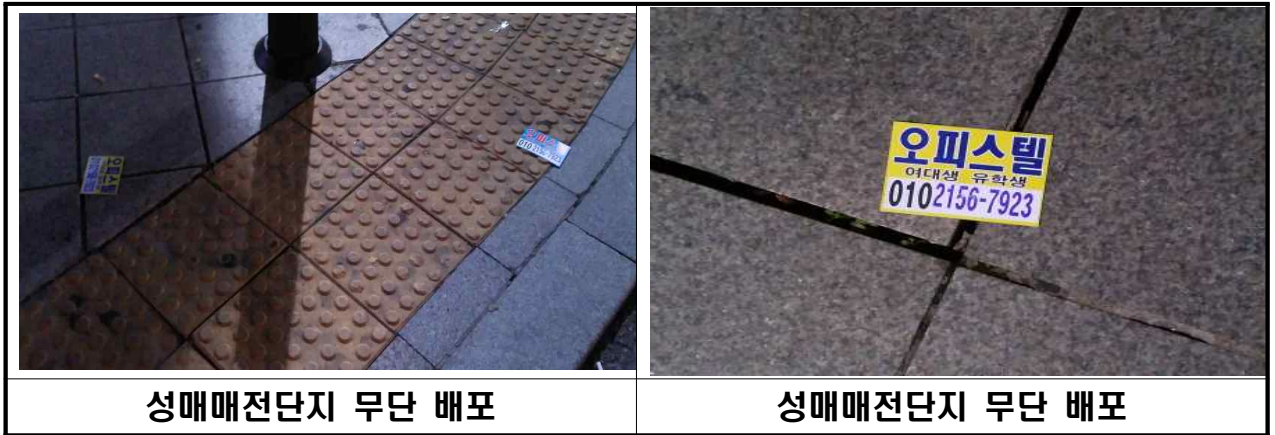
성매매전단지 무단 배포