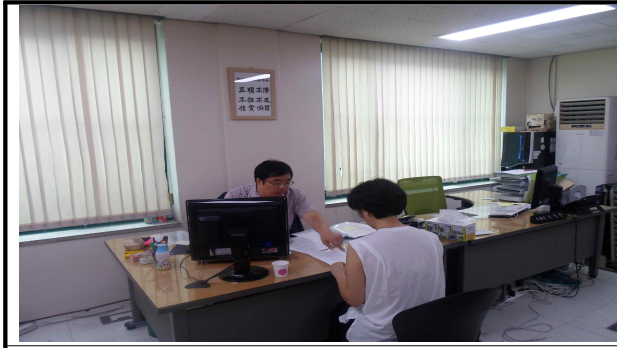
피의자 신문 시행