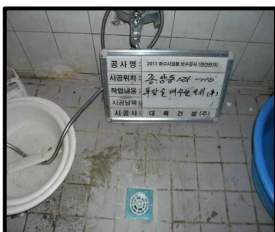
옥내역지변 (화장실 등)