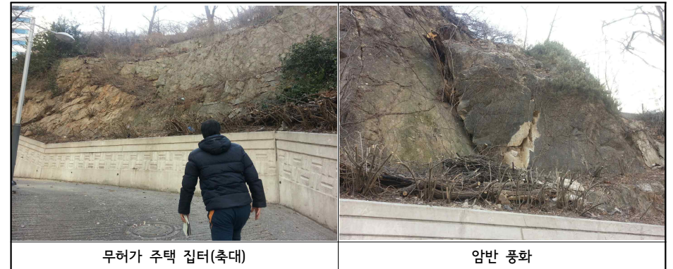
무허가 주택 집터(축대)