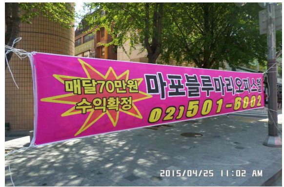
도시계획과 - 신사역 불법현수막 정비