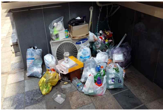
청소행정과 - 봉은사로 쓰레기 배출시간 위반