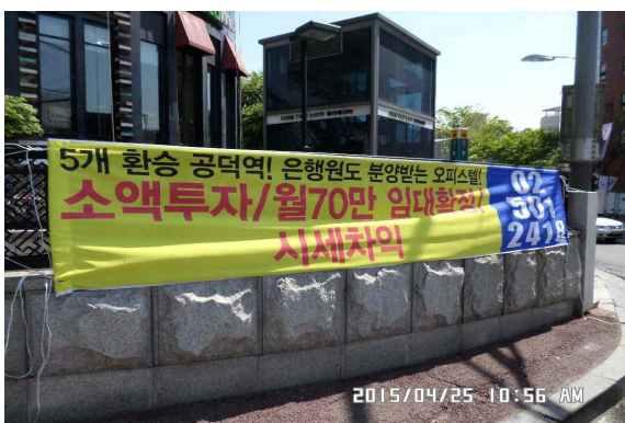
도시계획과 - 강남대로 논현역 현수막 정비