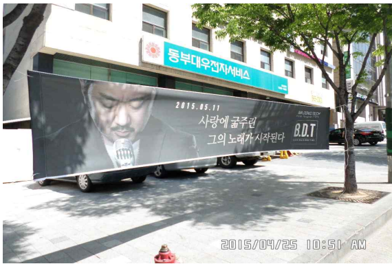
도시계획과 - 봉은사로 불법현수막 정비