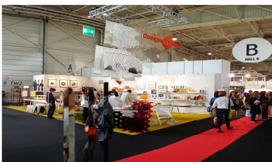
2014 파리 메종&오브제