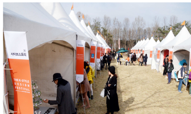
헤럴드 디자인 마켓(상반기)