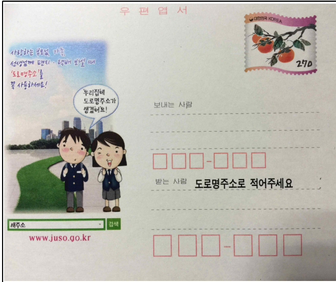
<도로명주소 엽서 앞면>