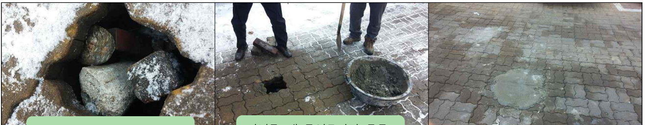
연희동 제3공영주차장 동공 1