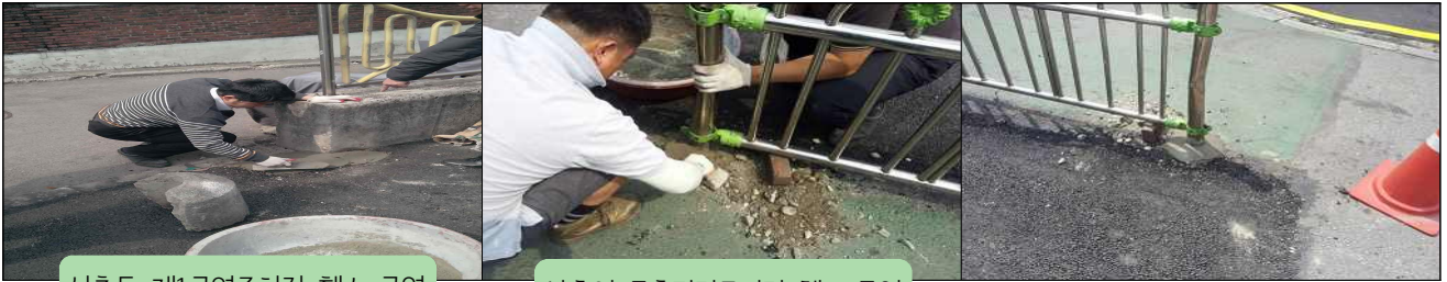
신촌동 제1공영주차장 휠스 균열