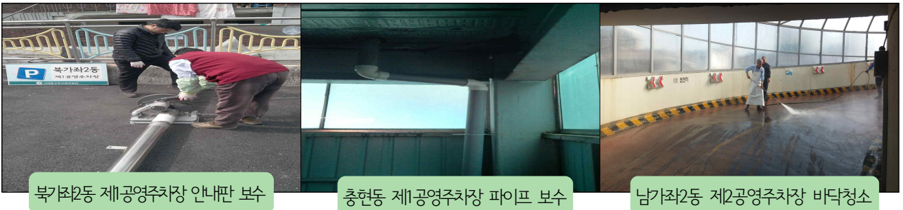
북가좌2동 제1공영주차장 안내판 보수