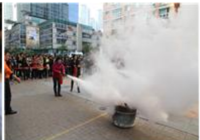
목동 행복한세상 백화점