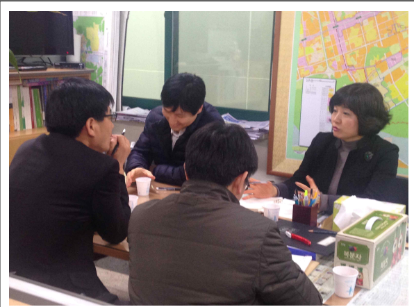
☞ 간판개선사업 추진방법(노하우)의견교환