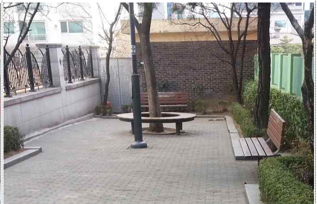
건물벽 둘레 화단조성 및 식재