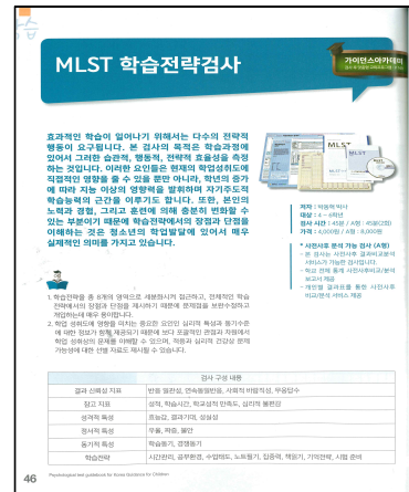
[검사 : MLST(학습전략검사)]