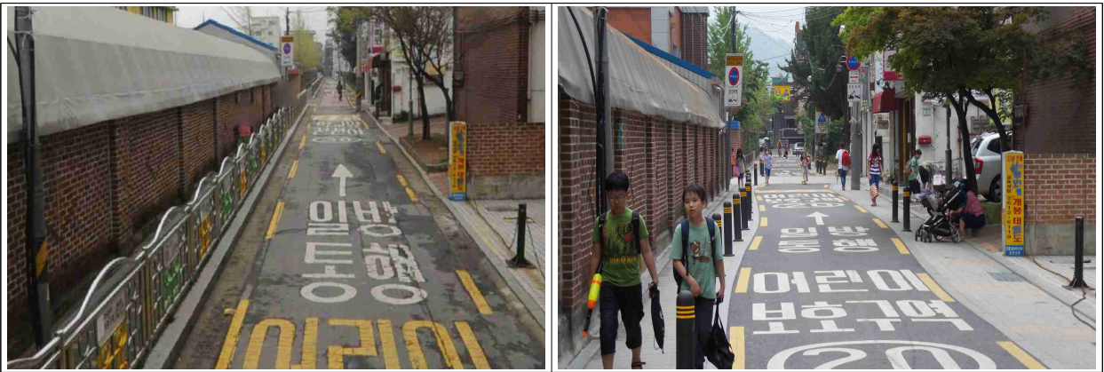
▲ 도로 골목구간(개봉초등학교 앞)