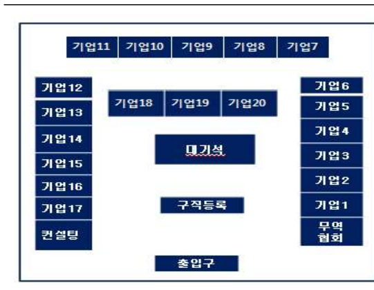
[ 현장 배치도 ]