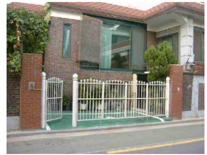
<현재-현관 출입문 주변 목책문 설치> <개선-담장경계에 개폐식 목책문 설치> <공사비 반환대상-주차장기능미유지>