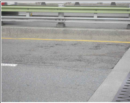
교면포장 마모 (본교-S10)