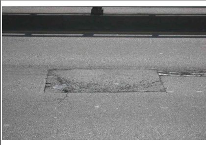
교면포장 보수부 파손 (본교-S5)