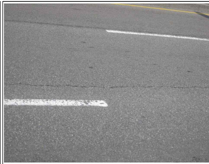
교면포장 균열 (본교-S11)