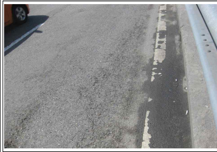
교면포장 망상균열 (본교-S9)