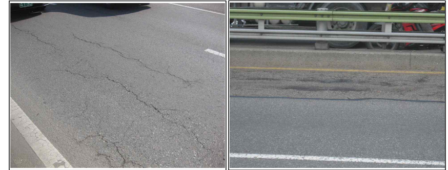
교면포장 망상균열 (본교-S 1 )