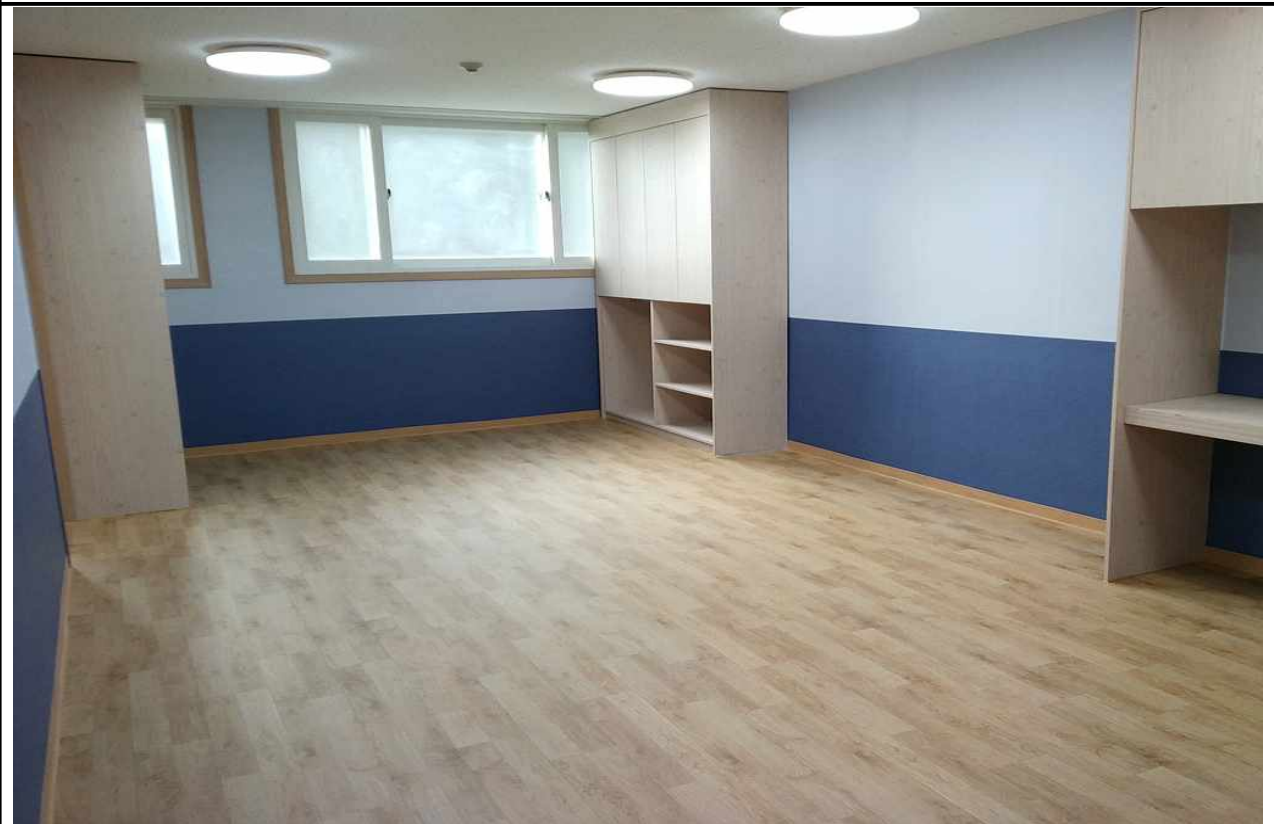
극동그린 보육실-1 (1층)