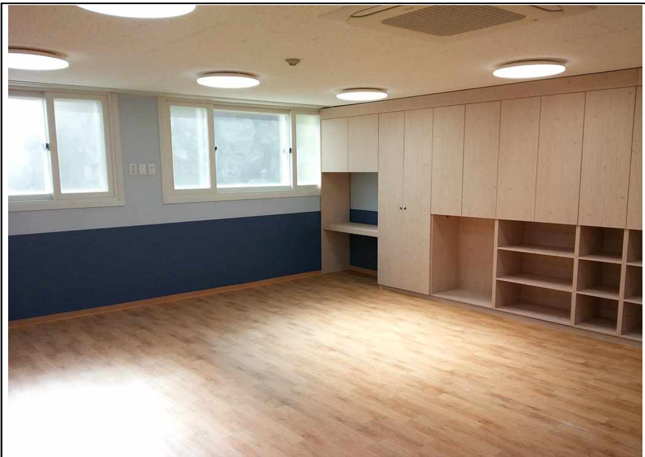
극동그린 보육실-2 (1층)