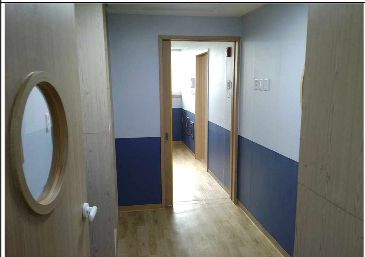
극동그린 원장실·교사실 (1층)