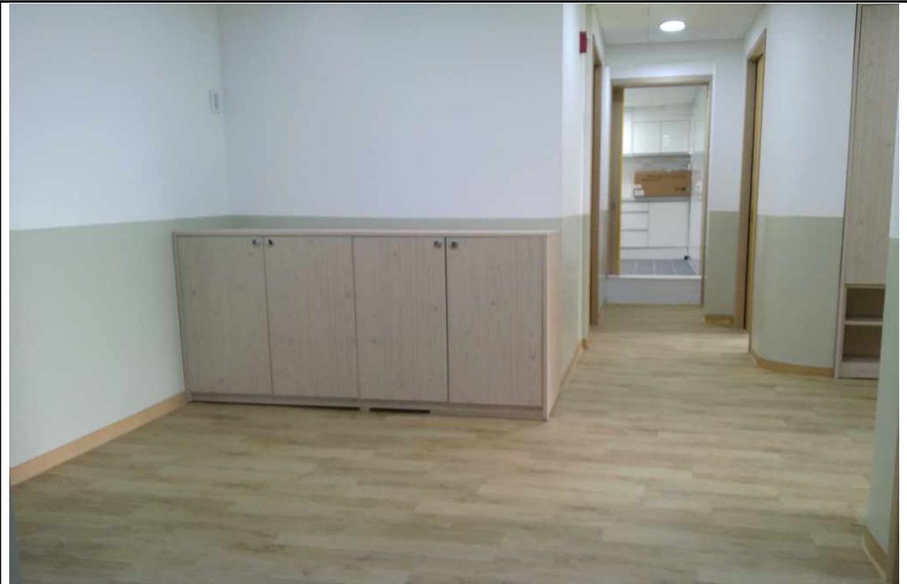
극동그린 홀.복도 (1층)