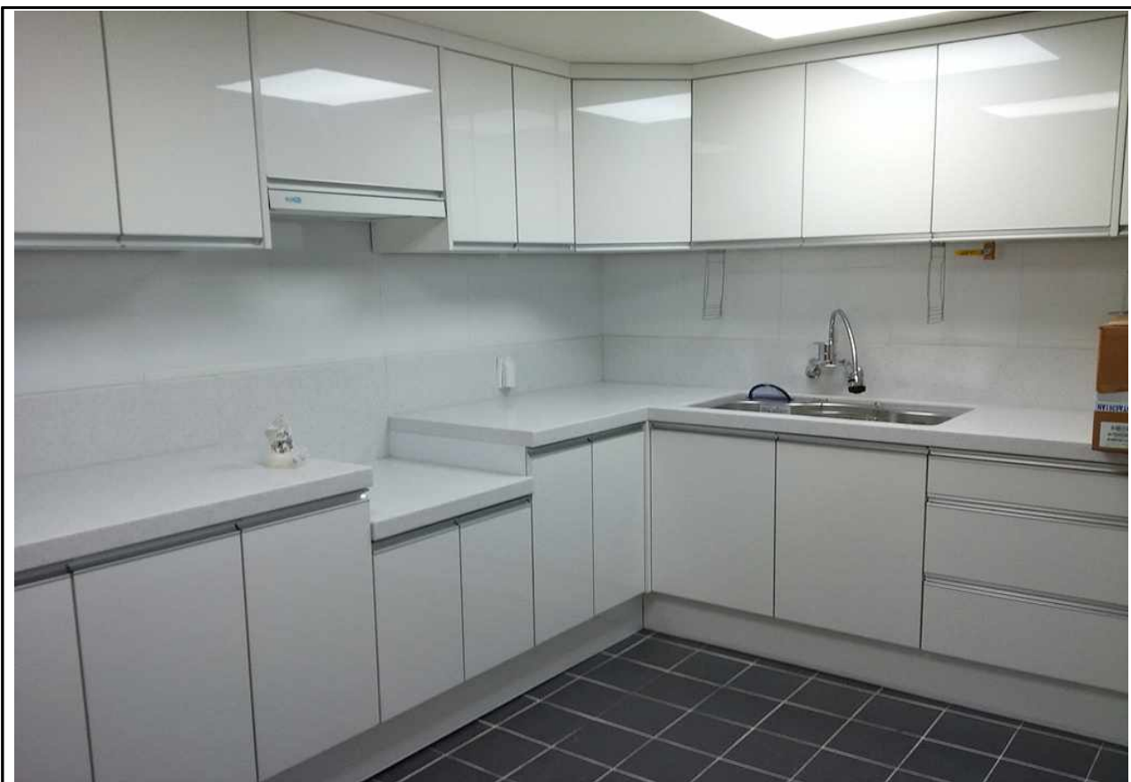
극동그린 주방 (1층)