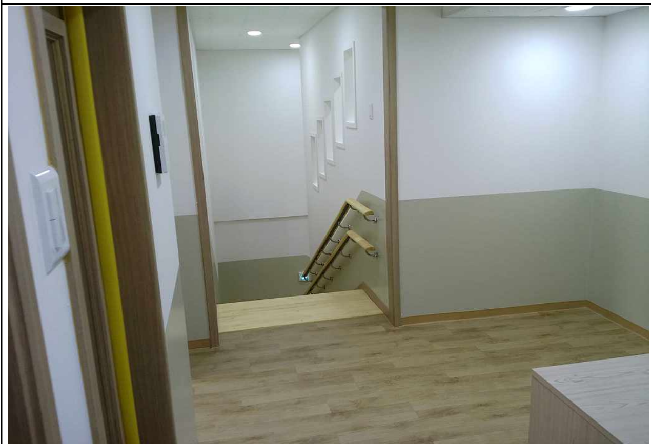
극동그린 홀·계단실 (2층)