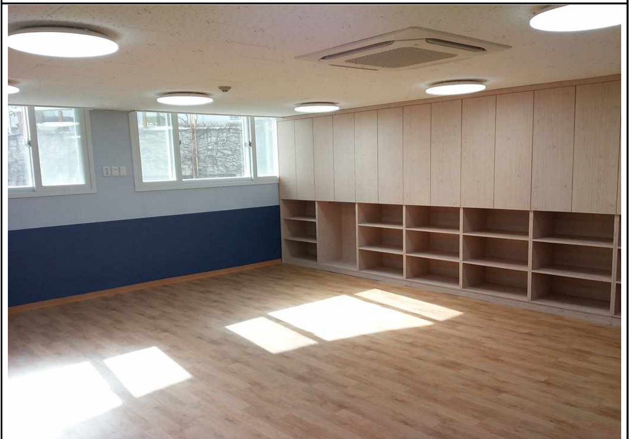
극동그린 보육실-4 (2층)