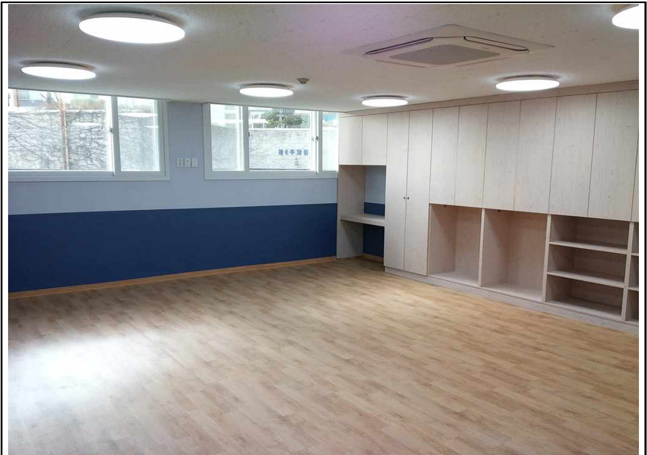
극동그린 보육실-3 (2층)