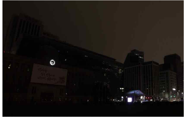
<신청사 및 주변건물 소등 후>