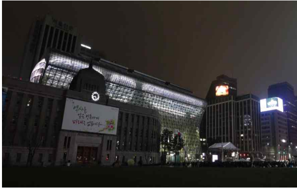
<신청사 및 주변건물 소등 전>