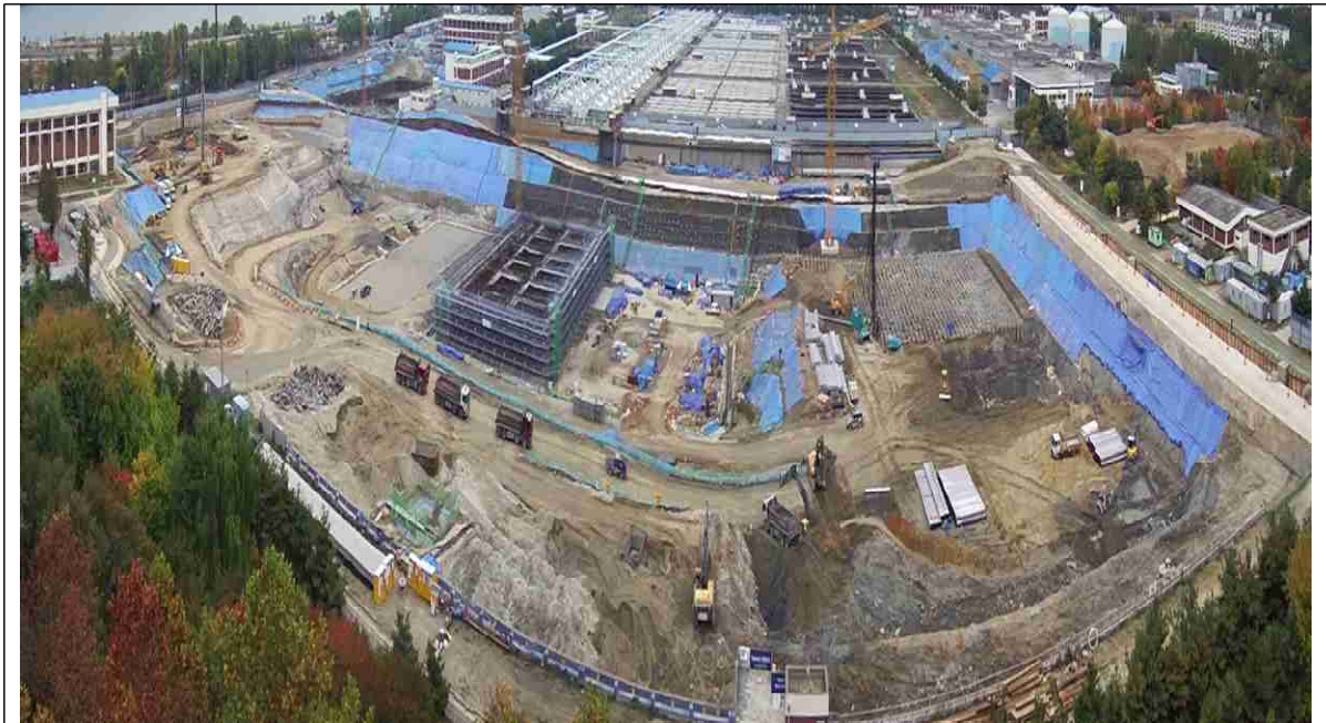
1처리장 1,2계열 전경