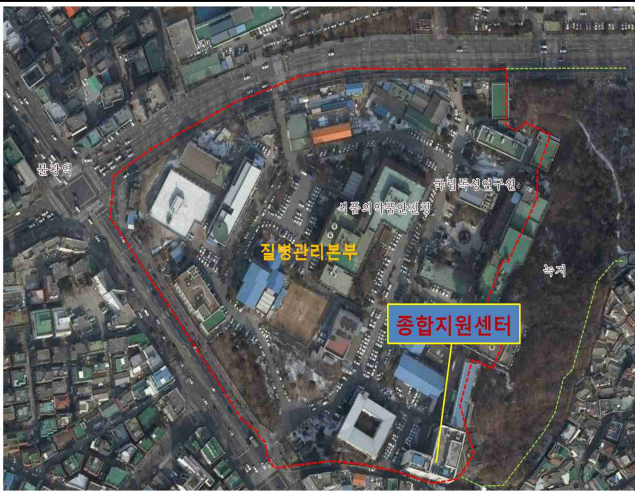
위 치 도