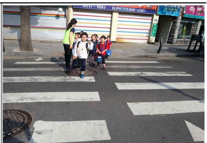
< 홍 제 초 교 >