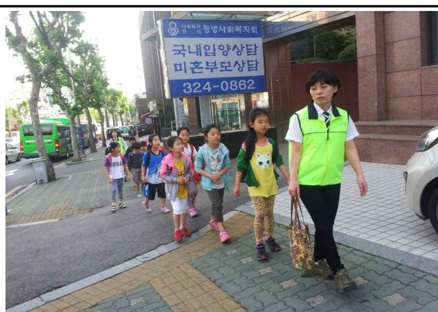
< 창 서 초 교 >